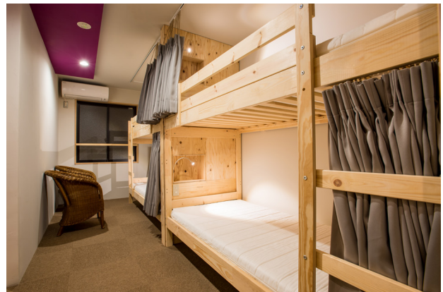
●3号室内(女性専用部屋)